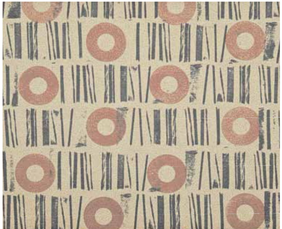
In Kombination mit einem großen Ballen-Druckschutzpflaster (Projekt 6) mit Stempelkissen auf Tonpapier gestempelt.