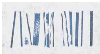
Mit einem Stempelkissen gestempelt.