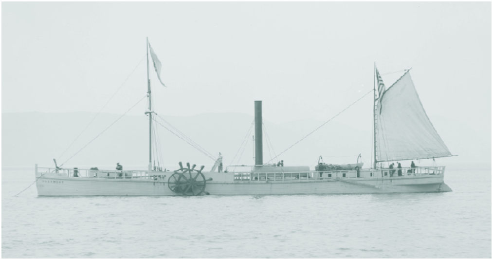
DIE Clermont (North River Steamboat), siehe Seite 64